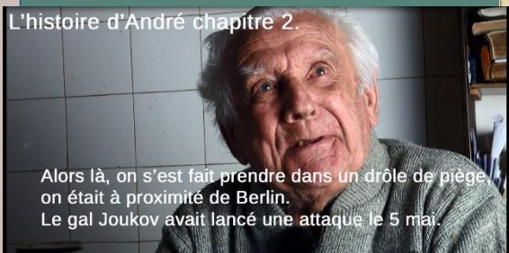
L'histoire d'André chapitre 2

Alors là, on s'est fait prendre dans un drôle de piège on était à proximité de Berlin. Le gal Joukov avait lancé une attaque le 5 mai.